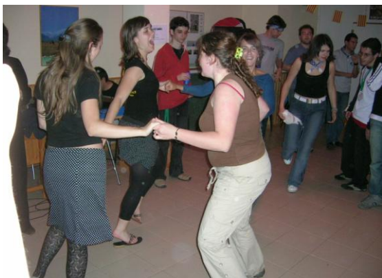
Foto 4. El concurs de ball va tenir un fort grau d'implicació per part dels

Per gentilesa de l'Ajuntament de Vilafranca, el dilluns 30 d'abril hi va haver una demostració de diferents balls típics, tant a nivell regional com estatal. Posteriorment, i per a que els participants poguessin demostrar la seva traça, es va fer un concurs