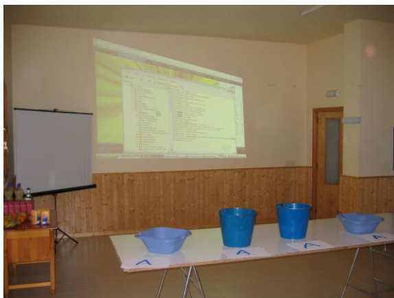
Foto 3. Tot apunt pel concurs de preparació de Sangria

La primera activitat nocturna que es va fer pretenia apropar a tots els participants a alguns aspectes de la cultura, les tradicions i l'actualitat espanyola, catalana i valenciana. Per tal de fer-ho d'una manera distesa es va fer en forma de concurs: un concurs de preparació de sangria. Es tractava de fer diferents grups, i cadascun d'aquests havia d'anar responant les preguntes que s'anaven fent (relacionades amb temes culturals i d'actualitat, com ja s'ha dit). Aquells grups que encertaven tenien dret a escollir un ingredient per a l'elaboració de la sangria, dels molts que teníem exposats. Òbviament hi havia molts ingredients que no tenien res a veure amb l'elaboració de la sangria, però aquí entrava en joc la destresa dels participants. Un cop finalitzada la ronda de preguntes un jurat format per 5 organitzadors van tastar totes les sangries, i es va decidir quina era la que s'aproximava més a la típica beguda espanyola que tant agrada als estrangers. Es va obsequiar als guanyadors amb una ampolla de vi.