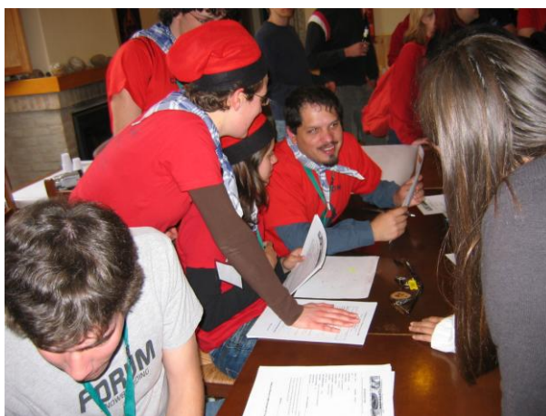
Foto1. El registre dels participants va ser un dels moments més moguts del Congrés

Les tasques del registre les desenvoluparen 8 organitzadors. 2 organitzadors es dedicaven a omplir el full de registre i el full de sortides de cada participant, i donaven les claus de les habitacions. 2 organitzadors més donaven l'acreditació de cada participant, els diferents obsequis (got i bossa del congrés), i la possibilitat de comprar la samarreta oficial d'aquest. Per tal de justificar la subvenció europea d'INJUVE era necessari escanejar tots els bitllets que haguessin utilitzat els participants per venir al congrés; de nou una parella d'organitzadors dedicats a aquesta feina. El ritme d'escaneig era més lent que el de la resta de feines del registre. A més, tot i que dies abans s'havia avisat a tots els participants que guardessin tot allò que utilitzessin per viatjar, molts d'ells s'havien desfet de la targeta d'embarcament -bàsica per demostrar que havien viatjat en avió-. Per últim, els 2 organitzadors restants s'encarregaven de cobrar les samarretes i les fiances dels llençols i les tovalloles que ens proporcionava l'alberg. Per tal d'amenitzar l'espera, durant el registre van oferir-se productes típics de la zona: mistela i rosques (que s'havien anat a comprar al matí)