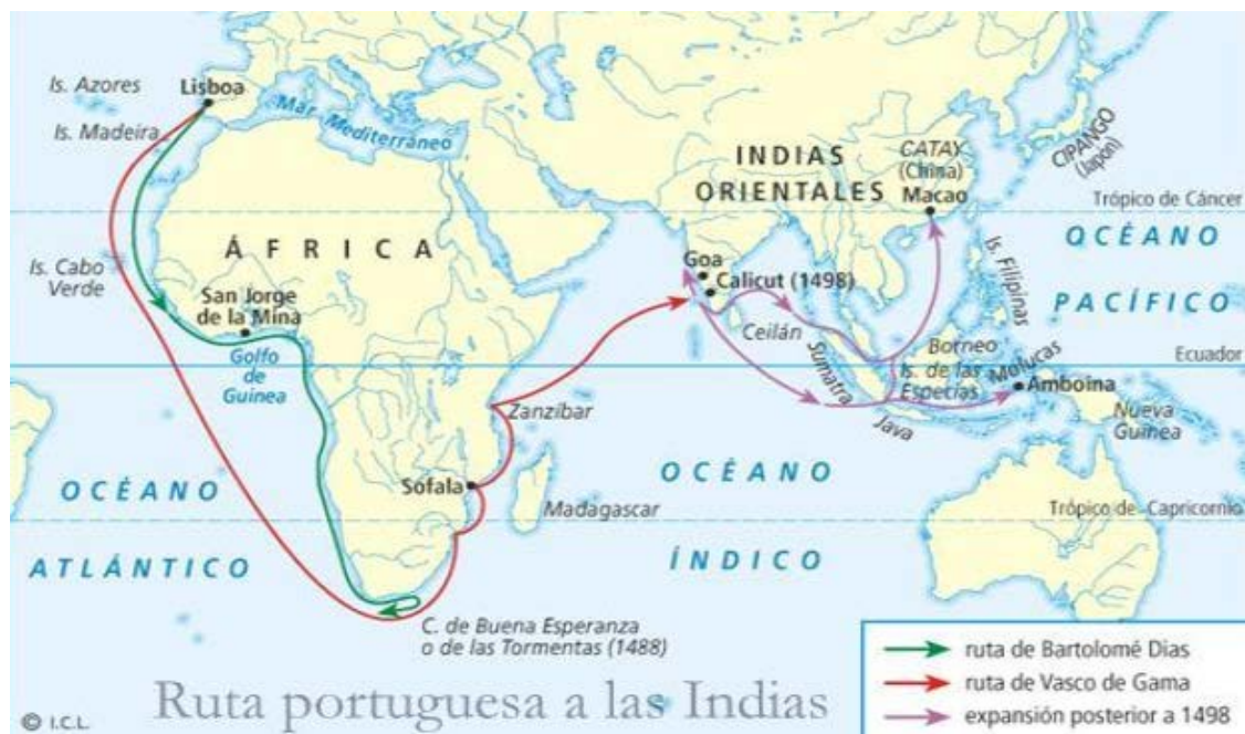
Descobrimet de la costa occidental africana i la ruta a l'Índia de Vasco da Gama

El 1453 l'Imperi Otomà conqueria Constantinoble tancant les rutes d'Orient cap a la Mediterrània i desproveïa a la noblesa i la burgesia europea d'espècies, teixits, encens..., productes que els distingia socialment. S'imposava doncs, cercar una nova ruta comercial per accedir a l'Índia. Bartolomeu Dias va doblar el cap de Bona Esperança (1487) i Vasco da Gama el 20 de maig de 1498 arribava a la costa de Malabar (sud-oest de l'Índia) quedant oberta definitivament la ruta atlàntica a l'Índia.